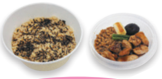
地区商品の開発例